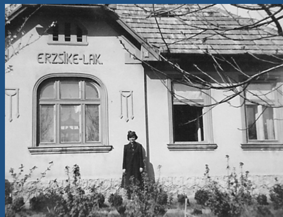
Az Erzsike-lak Alsógödön, a Rákóczi Ferenc utcában, 1939-ben